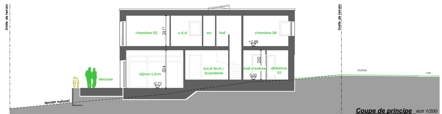
Coupe de principe éch 1/200

Surface dans l'enveloppe énergétique (suivant CPE) Habitable : +/- 179m 2 Non-habitable : +/- 14m 2 Surface hors de l'enveloppe énergétique : +/- 35m 2