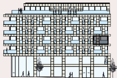
Rue de l'Alzette / Facade avant