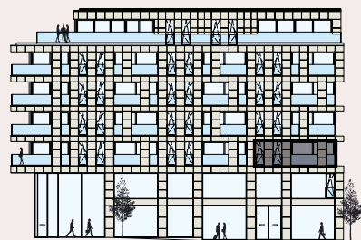
Rue de l'Alzette / Facade avant