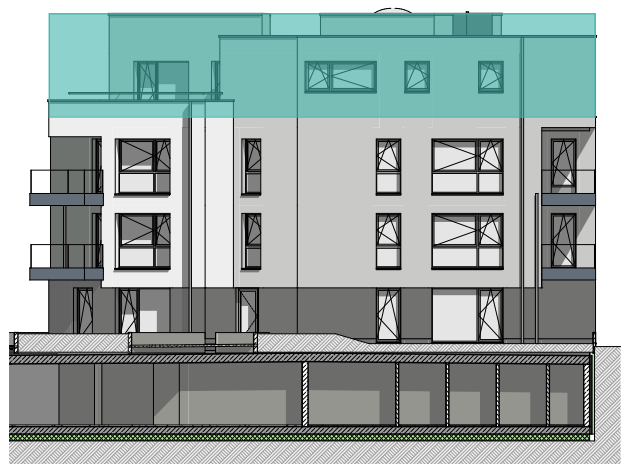
façade latérale droite