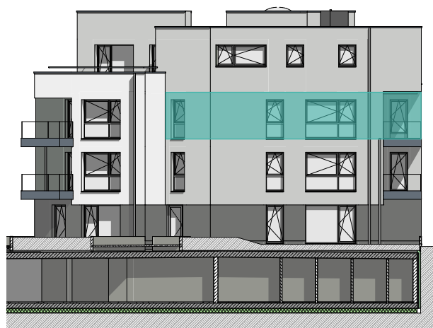
façade latérale droite

BENG ARCHITECTES ASSOCIES Architecture, urbanisme 12, av. du Rock'n'Roll L-4361 Esch-sur-Alzette