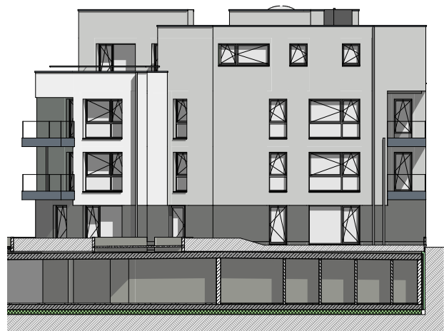
façade latérale droite

BENG ARCHITECTES ASSOCIES Architecture, urbanisme 12, av. du Rock'n'Roll L-4361 Esch-sur-Alzette